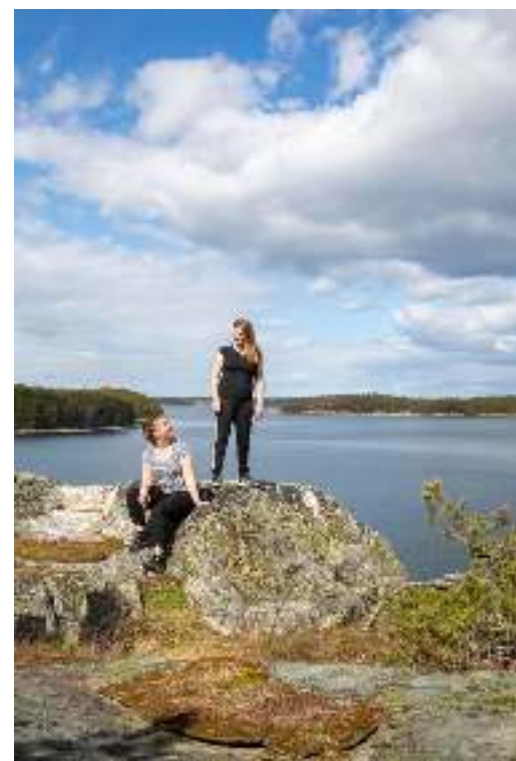
Kuvateksti tag with

K uivat oksat ja kävyt rasahtelevat rikki kengän alla. Siellä täällä näkyy ruskeita papanoita, ollaanhan lampaiden laidunalueella. Polku kiemurtelee jyrkän kallion laelle.