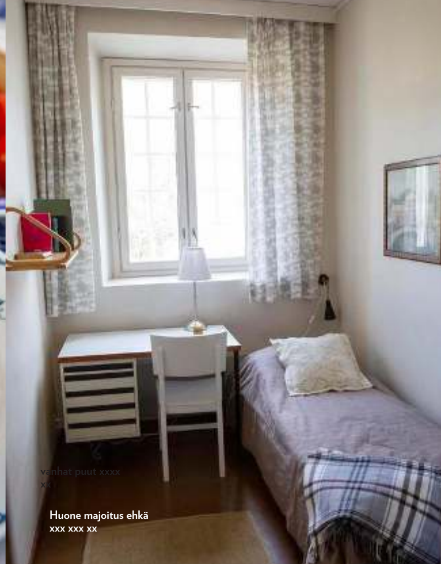
vanhat puut xxxx xx