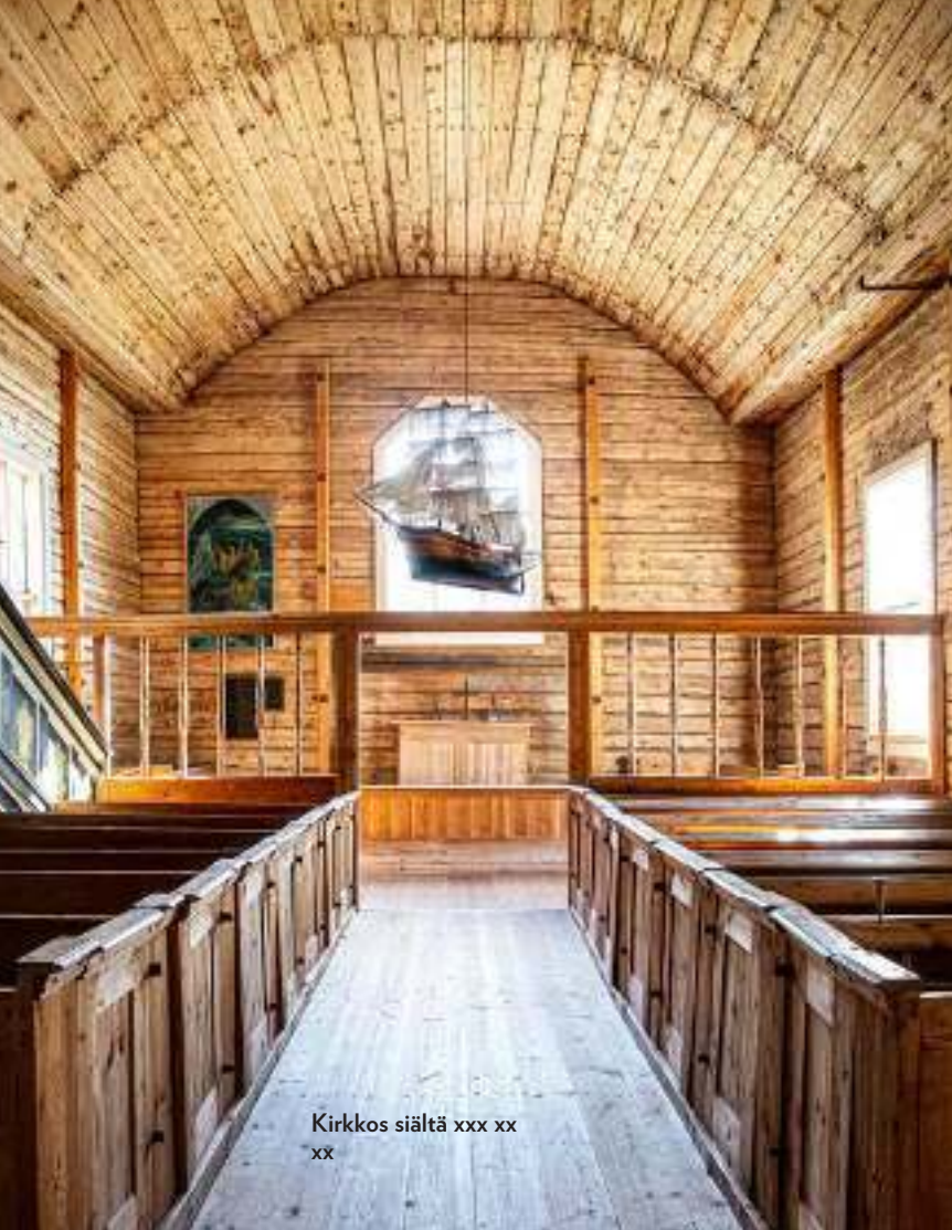
Kirkkos siältä xxx xx xx