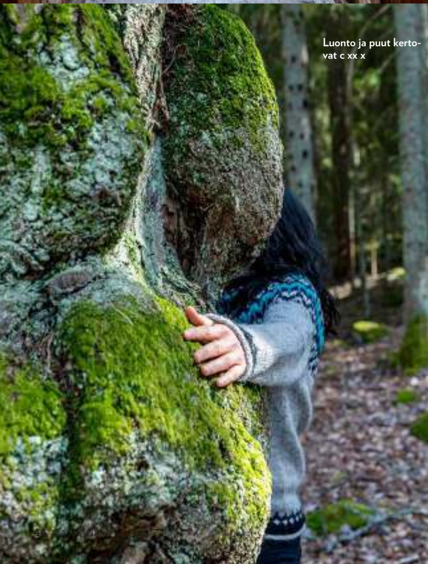
Luonto ja puut kerto- vat c xx x