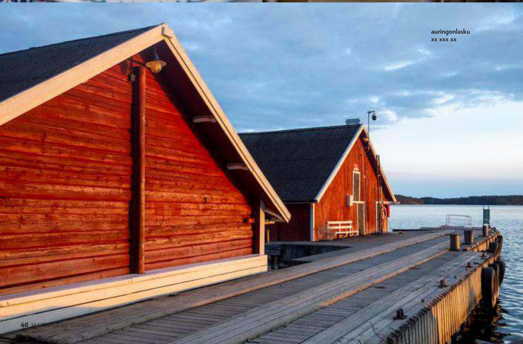
aurionlasku xx xxx xx