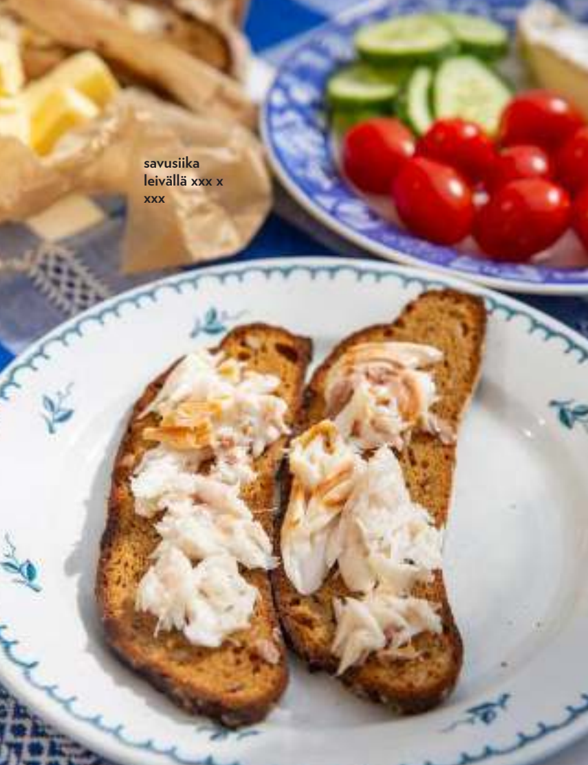
savusiika leivällä xxx x xxx