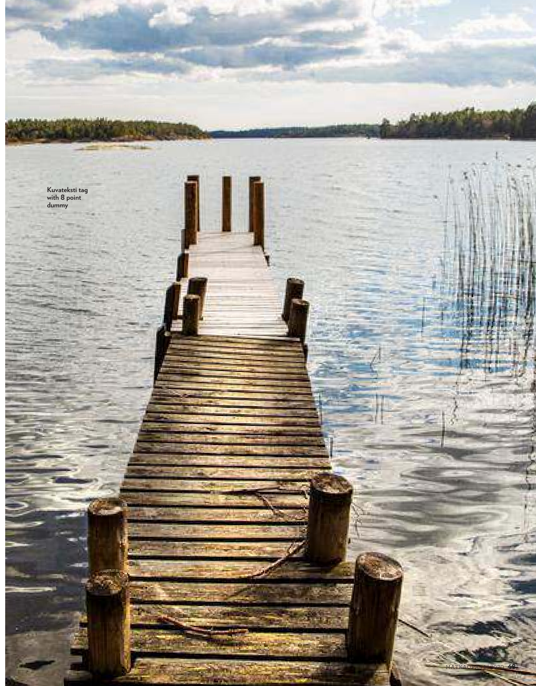
Kuvateksti tag with 8 point dummy