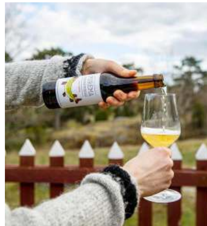
Kuvateksti tag with 8 point dummy text.Ku- vateksti tag with 8 point dummy text.Ku-

– Kirkon votiivilaiva uusittiin 1980-luvulla.