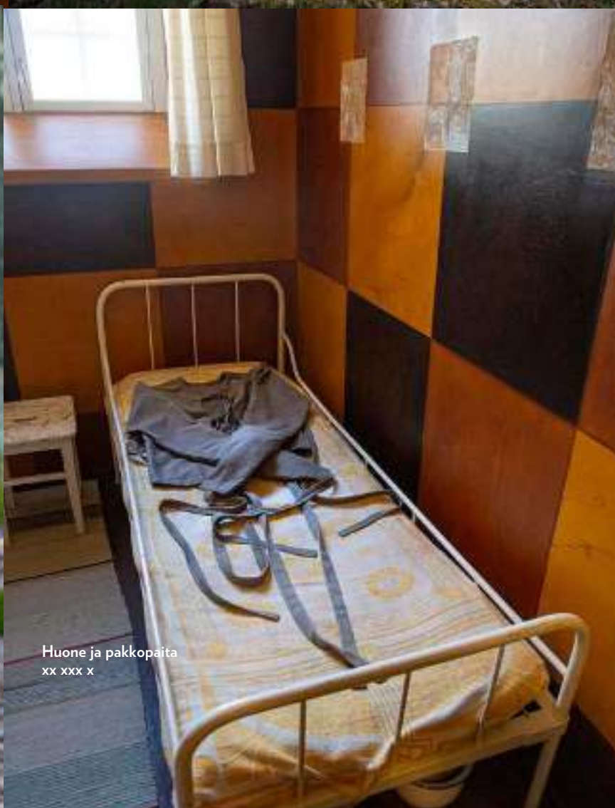
Huone ja pakkopaita xx xxx x

rella vapaasti ja esimerkiksi marjastaa ja sienestää, kun taas toiset pääsivät ulkoilemaan aidatulla alueella tunnin päivässä.